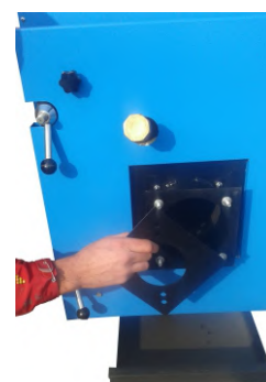
Εύκολη αλλαγή φλάντζας καυστήρα πέλλετ και καυστήρα πετρελαίου