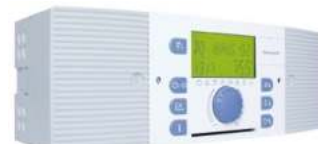
Ηλεκτρονικός Πίνακας SMILE, πολλαπλών λειτουργιών. (Διατίθεται σε διάφορες εκδόσεις)