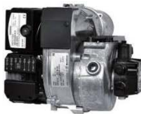
Καυστήρας Bentone BF1 KA