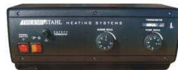
Πίνακας οργάνων μονοβάθμιος EN-I