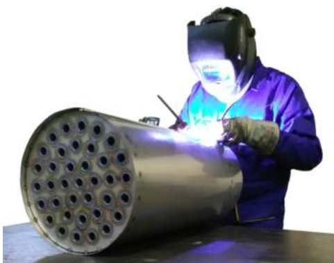
Κατασκευή εναλλάκτη συμπύκνωσης από ανοξείδωτο χάλυβα και συγκόληση TIC