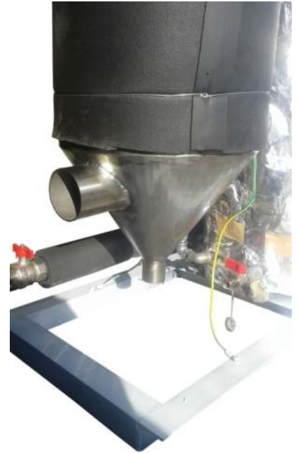
Έξοδος καυσαερίων και απόληξη συγκέντρωση συμπυκνωμάτων