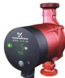
Κυκλοφορητής Grundfos Alpha2

Εγγύηση ανοξειδωτου εναλλάκτη 5 έτη Εγγύηση καυστήρα και κυκλοφορητή 3 έτη Εγγύηση ηλεκτρικών - ηλεκτρονικών εξαρτημάτων 3 έτη