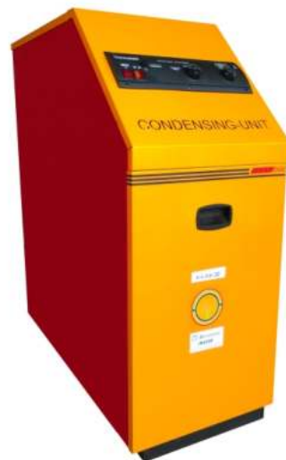
Μονάδα συμπύκνωσης πετρελαίου e-line