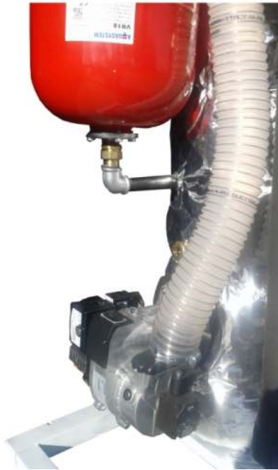
Καυστήρας Bentone με αγωγό προσαγωγής προθερμασμένου αέρα καύσης