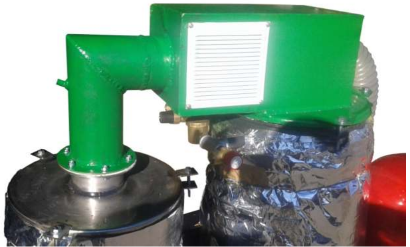
Θάλαμος προθέρμανσης αέρα καύσης και αγωγός προσαγωγής των καυσαερίων στον εναλλάκτη συμπύκνωσης