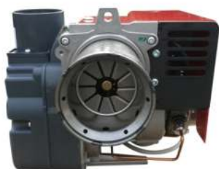
Καυστήρας Riello RDB-2.2 Νέο Μοντέλο ...με αντλία RBL (και για βιοντίζελ)

Εγγύηση ανοξειδωτου εναλλάκτη 5 έτη Εγγύηση καυστήρα και κυκλοφορητή 3 έτη Εγγύηση ηλεκτρικών - ηλεκτρονικών εξαρτημάτων 3 έτη