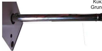
Καμινάδα 316-L INOX