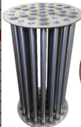
Σωλήνες καυσαερίων στο εσωτερικό του εναλλάκτη συμπύκνωσης