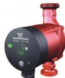
Κυκλοφορητής Grundfos Alpha2

Εγγύηση ανοξειδωτου εναλλάκτη 5 έτη Εγγύηση καυστήρα και κυκλοφορητή 3 έτη Εγγύηση ηλεκτρικών - ηλεκτρονικών εξαρτημάτων 3 έτη