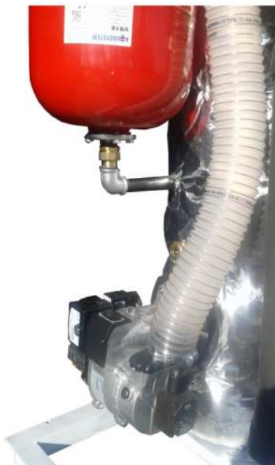
Καυστήρας Bentone με αγωγό προσαγωγής προθερμασμένου αέρα καύσης