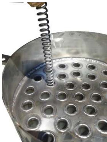
Ανοξείδωτος στροβιλιστής καπναερίων εντός του συμπυκνωτή (INOX). Αυξάνει την απόδοση, μειώνει τη θερμοκρασία καυσαερίων. Προστατεύει τον φλογοσωλήνα