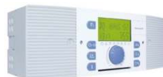
Ηλεκτρονικός Πίνακας SMILE, πολλαπλών λειτουργιών. (Διατίθεται σε διάφορες εκδόσεις)