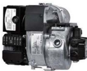
Καυστήρας Bentone BF1 KA