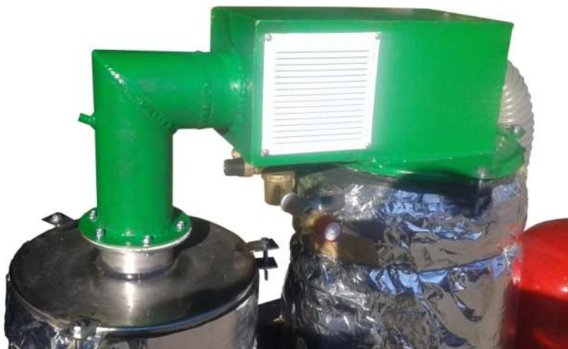
Θάλαμος προθέρμανσης αέρα καύσης και αγωγός προσαγωγής των καυσαερίων στον εναλλάκτη συμπύκνωσης