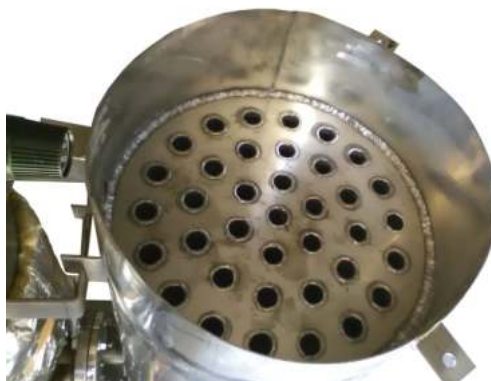
Σωλήνες καυσαερίων στο εσωτερικό του εναλλάκτη συμπύκνωσης