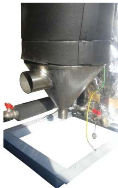
Έξοδος καυσαερίων και απόληξη συγκέντρωση συμπυκνωμάτων