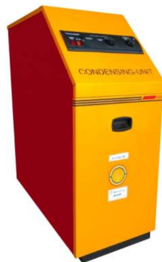
Μονάδα συμπύκνωσης πετρελαίου e-line