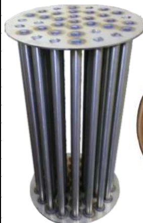
Σωλήνες καυσαερίων στο εσωτερικό του εναλλάκτη συμπύκνωσης