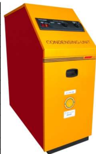
Μονάδα συμπύκνωσης πετρελαίου e-line