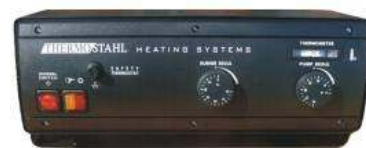
Πίνακας οργάνων μονοβάθμιος EN-1