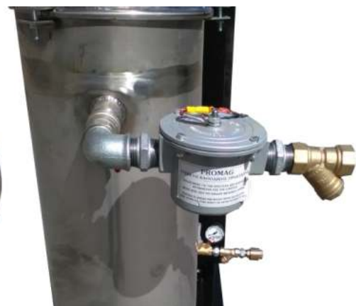
Ανόδιο μαγνησίου, τοποθετημένο στον εναλλάκτη συμπύκνωσης