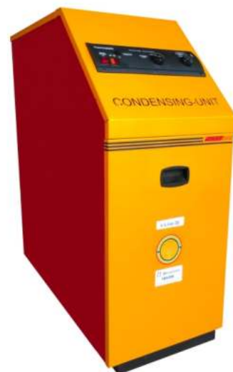
Μονάδα συμπύκνωσης πετρελαίου e-line

Εγγύηση εναλλάκτη 5 έτη Εγγύηση καυστήρα και κυκλοφορητή 3 έτη Εγγύηση ηλεκτρικών - ηλεκτρονικών εξαρτημάτων 3 έτη