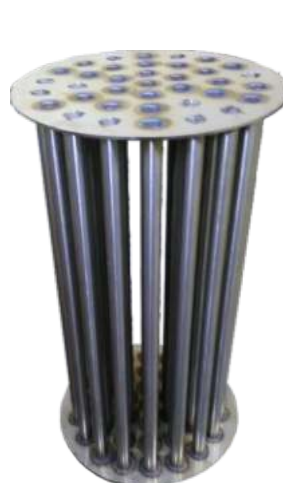
Σωλήνες καυσαερίων στο εσωτερικό του εναλλάκτη συμπύκνωσης