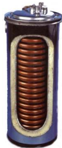
Ταχυμπόιλερ ζεστού νερού χρήσης Aqua-Matic 1000