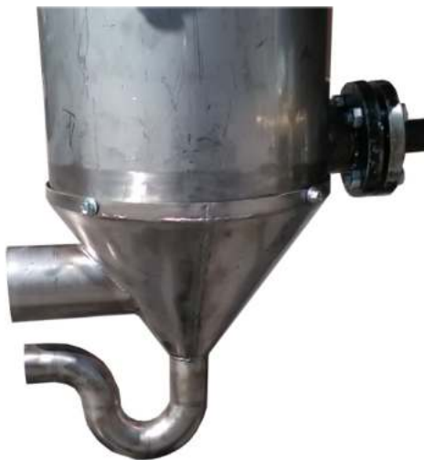
Απόληξη ανοξείδωτου εναλλάκτη με σωλήνα απορροής συμπυκνωμάτων και έξοδο καυσαερίων