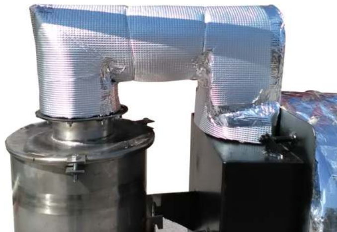
Καπναγωγός λέβητα - Συμπυκνωτή διαιρέτος