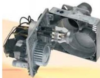
Καυστήρας Baltur BTL-10 ανοιγόμενο για εύκολο service