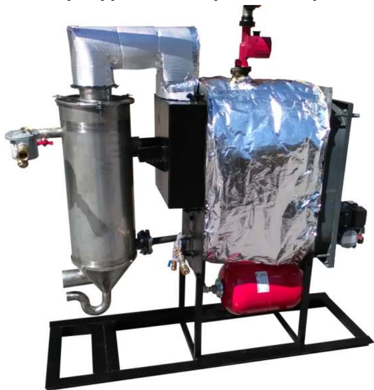
Συγκρότημα συμπύκνωσης καυσαερίων e-Line 70 με όλα τα εξαρτήματά του