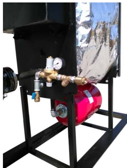
Γραμμή πλήρωσης νερού και δοχείο διαστολής κάτω από τον λέβητα