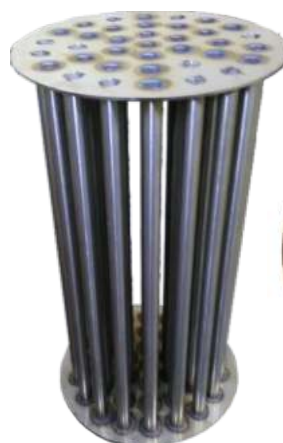
Σωλήνες καυσαερίων στο εσωτερικό του εναλλάκτη συμπύκνωσης