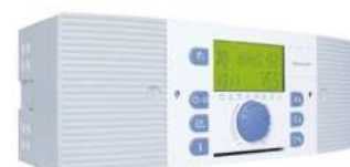
Ηλεκτρονικός Πίνακας SMILE, πολλαπλών λειτουργιών. (Διατίθεται σε διάφορες εκδόσεις)