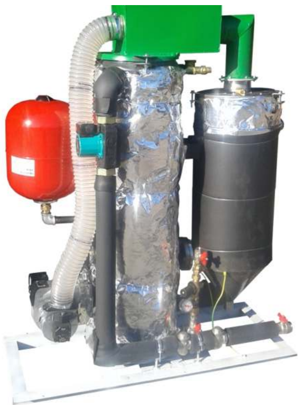
Συγκρότημα συμπύκνωσης καυσαερίων e-Line 20 με όλα τα εξαρτήματά του