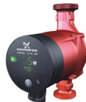
Κυκλοφορητής Grundfos Alpha2