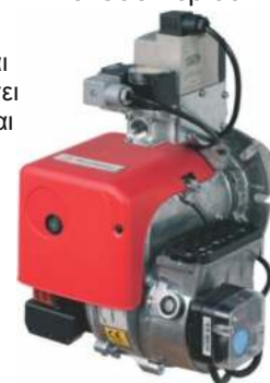
Καυστήρας Αερίου Bentone BFG1-H3-65

Οι καυστήρες αερίου Bentone είναι εγκεκριμένοι και πιστοποιημένοι βάσει των προτύπων DIN 4788, EN 676 και σύμφωνα με τις οδηγίες συσκευών αερίου 90/396/EOK, οδηγίες ηλεκτρομαγνητικής συμβατότητας 89/336/EOK και οδηγίες χαμηλής τάσης 73/23/EOK