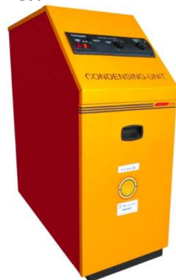
Μονάδα συμπύκνωσης e-line-Gas Αερίου

Εγγύηση λέβητα και εναλλάκτη 10 έτη Εγγύηση καυστήρα και κυκλοφορητή 5 έτη Εγγύηση ηλεκτρικών - ηλεκτρονικών εξαρτημάτων 2 έτη