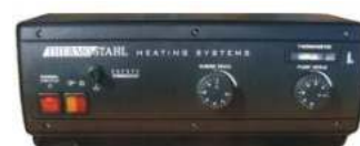
Πίνακας οργάνων μονοβάθμιο EN-1