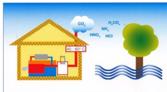
Σύστημα καύσης συμπύκνωσης e-Line