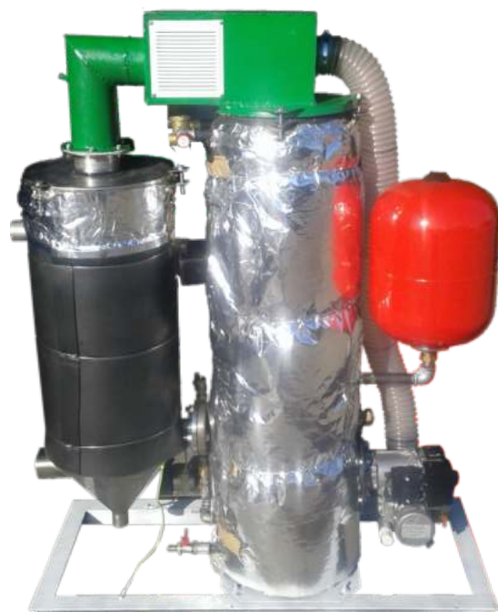
Συγκρότημα καύσης με συμπύκνωση των καυσαερίων e-Line-20