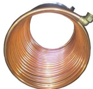
Χάλκινος εναλλάκτης για ζεστά νερά χρήσης (12 m - Φ15x1 mm) της έκδοσης Sanit